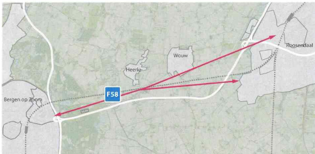
Globaal tracé snelfietsroute

Het ontwerp van de snelfietsroute is daarna nog verder uitgewerkt en uitgedetailleerd. Daarbij zijn nog verschillende mogelijkheden onderzocht, mede op verzoek van de provincie. Bijvoorbeeld een ongelijkvloerse kruising met de spoorlijn, die is uiteindelijk vanwege de hoge kosten afgefallen. Het tracé is door adviesbureau Arcadis uitgewerkt tot Voorlopig Ontwerp. Wij zullen beide raden en de belanghebbenden afzonderlijk informeren over het precieze tracé en het ontwerp.