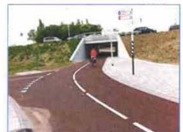
Referentiebeelden: snelfietsroutes Hengelo-Enschede en Nijmegen-Beuningen