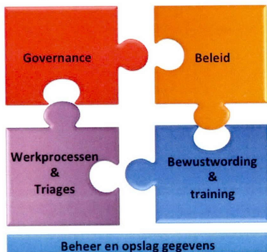
Figuur 1: Raamwerk Privacy (VNG)

De aanpak wordt doorlopen aan de hand van het door de VNG ontwikkelde implementatieplan "Privacy sociaal domein". Dit plan richt zich op vijf gebieden te weten "Governance", "Beleid", "Werkprocessen en Triage", "Bewustwording en communicatie" en "Beheer en opslag van gegevens". Deze deelgebieden hangen met elkaar samen en zijn de vijf randvoorwaarden om privacy in het sociaal domein goed te regelen.